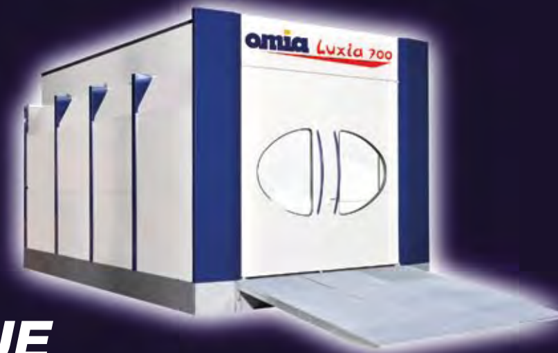
Modèle présenté sur soubassement métallique avec rampe pleine extérieure (optionnel).