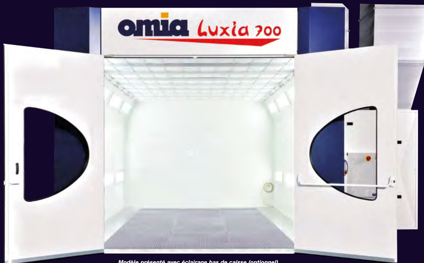
Modèle présenté avec éclairage bas de caisse (optionnel).

L'alliance de l'ESPACE et de la TECHNOLOGIE AVANCEE